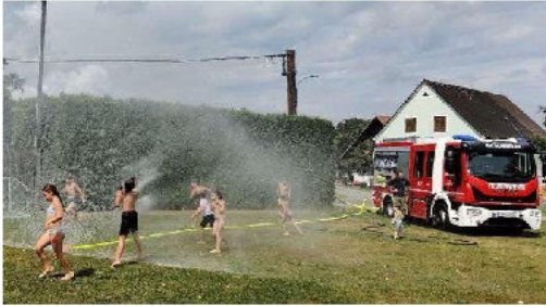
Bilder sagen mehr als 1.000 Worte

Am 27. Juli bekamen wir von den Kindern der Gemeinde Deutsch Goritz Besuch. Im Rahmen des Ferienprogramms konnten wir das Feuerwehrwesen präsentieren. Von Theorie über Action bis Spaß war alles dabei.