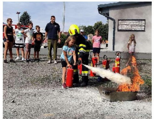
Die Kids durften ihr erstes Feuer löschen